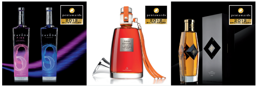
Linea CONCEPTUAL - GRAPHIC - DESIGN

C'est avec beaucoup de fierté et d'émotion que l'équipe LINEA a reçu trois distinctions le 4 Octobre dernier, lors de la 6ème cérémonie des PENTAWARDS , valorisant sans conteste la passion et l'expertise unique de l'agence en matière de spiritueux. La création CAVODA VODKA , la vodka la plus charismatique du moment, a été récompensée d'un Silver Award. Destinée à l'univers de la nuit, son approche graphique est en rupture avec les codes de reconnaissance de l'univers des vodkas, renforçant un peu plus la singularité de ce produit. Second Silver Award, pour la création d'une liqueur de cognac XO aromatisée à l'orange : FLEUR COGNAC habillée de verre, de cuir, et d'aluminium brossé. Enfin, un Bronze Award pour 22 MARQUIS , liqueur pétillante dont la bouteille semble avoir été directement sculptée dans un bloc de verre rehaussé d'une pierre d'Onyx.